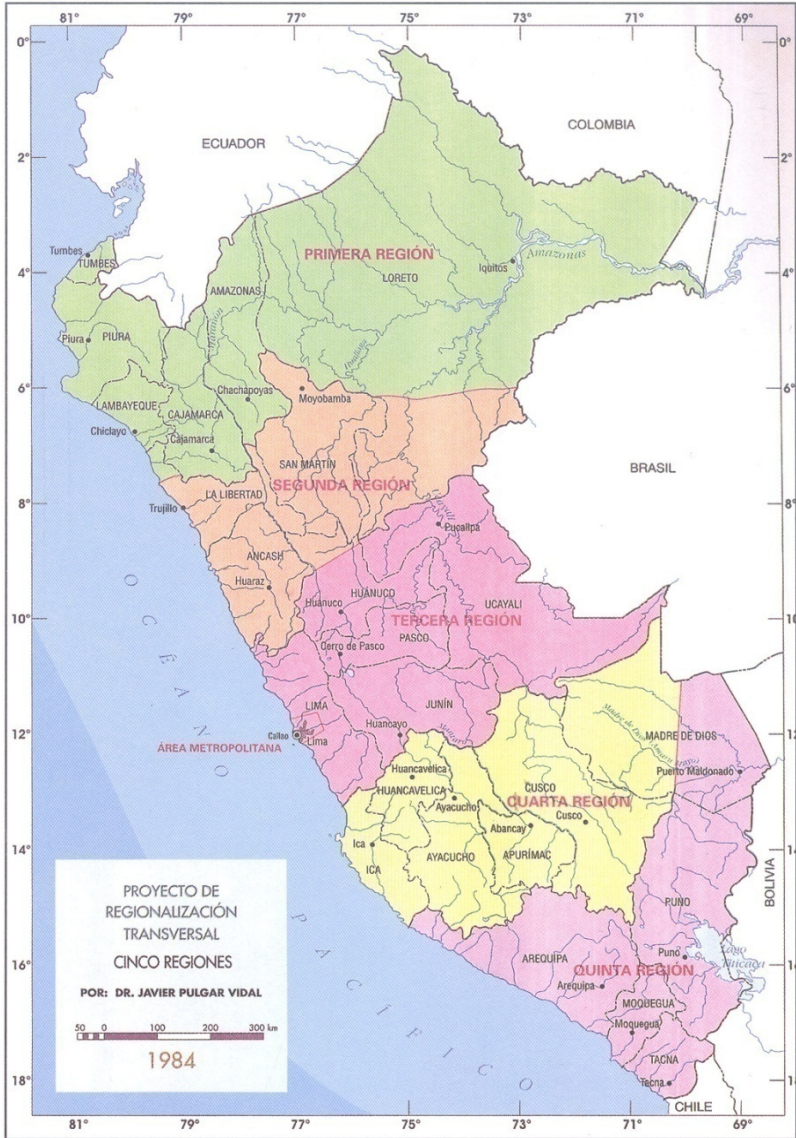
Mapa del Tercer Proyecto de Regionalización Transversal en Cinco Regiones y el Área Metropolitana del Dr. Javier Pulgar Vidal 1984