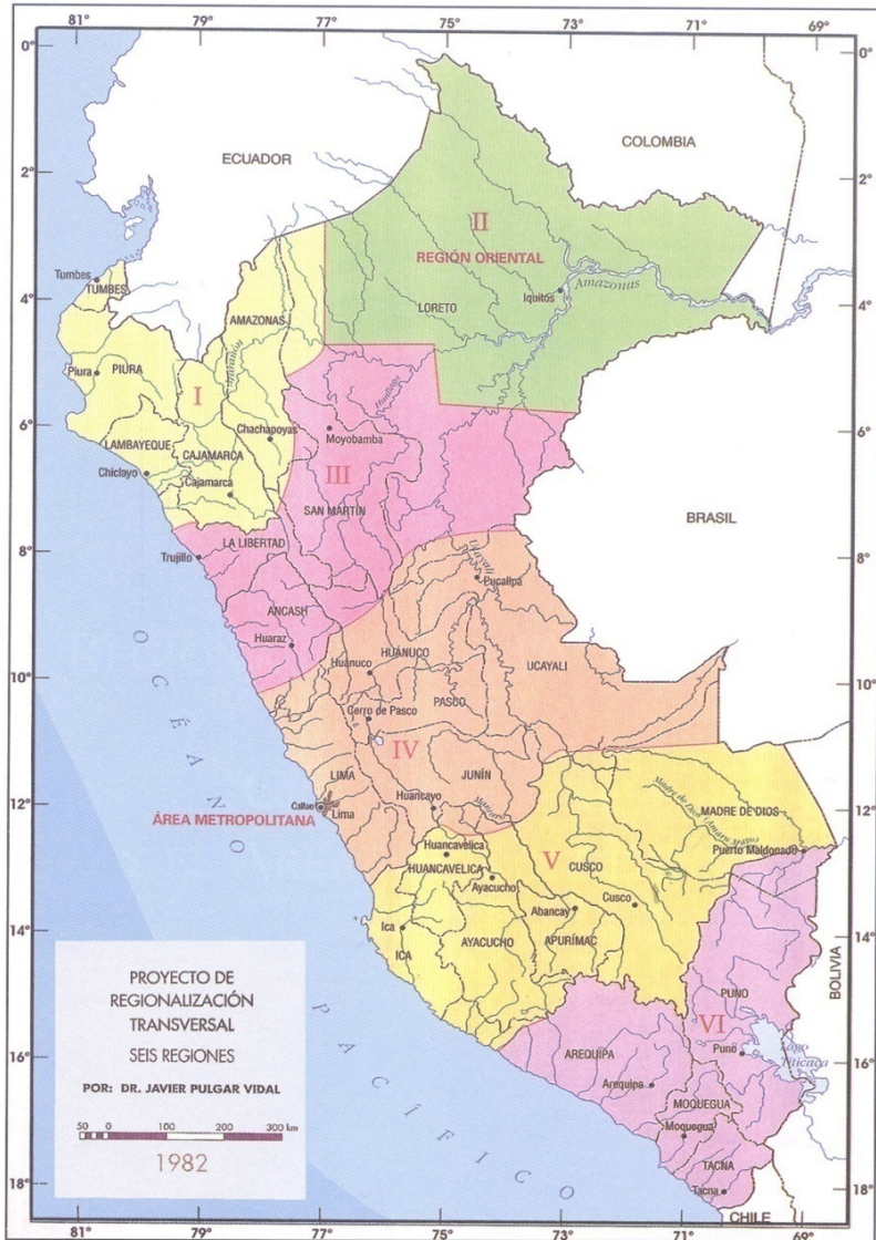
Mapa del Segundo Proyecto de Regionalización Transversal en Seis Regiones y el Área Metropolitana del Dr. Javier Pulgar Vidal 1982